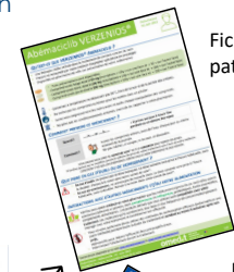
Fiche conseil patient